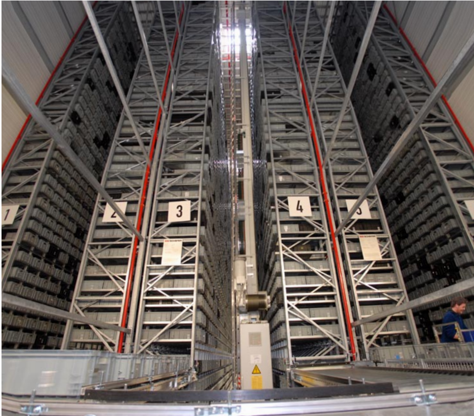
Das automatische Kasten-Lager (AKL) verfügt über eine Förderleistung von bis zu 200 Ein-/Auslagerungen Kästen pro Stunde.