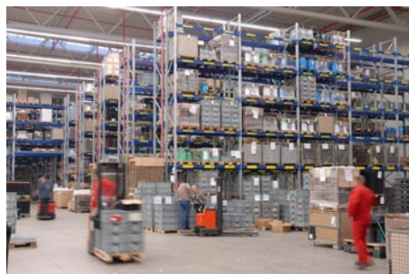
Das Palettenlager mit einer Kapazität von 3.210 Plätzen verfügt als Brandschutzeinrichtung über eine Decken- sowie eine Regalsprenklerinlage.