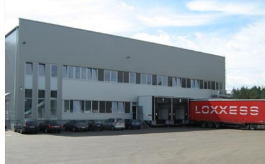
Das Objekt verfügt über sechs Verloaderampen zum Be- und Entladen.