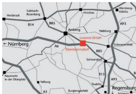
Das Logistik-Zentrum Ebermannsdorf/Amberg liegt verkehrsgünstig nahe der tschechischen Grenze.